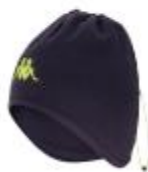
Bonnet et tour de cou Antun 12€