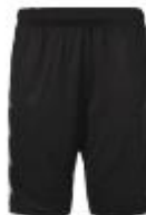
Short Domaso Junior : 21€/ Adulte : 23€