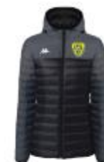
Doudoune Lamezia 64€