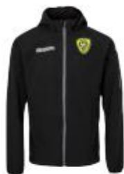
Veste Valas Junior : 56€/ Adulte : 62€