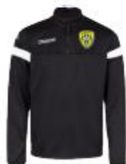
Sweat Novare Junior : 28€/ Adulte : 30€