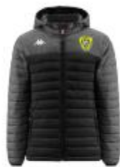
Doudoune Lamezio Junior : 58€ / Adulte : 64€