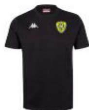
T-shirt Meleto Junior 12€/Adulte : 15€