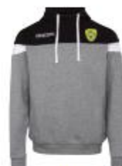
Sweat Accia 38€