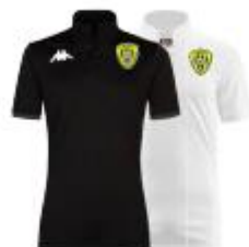
Polo Deggiano Junior : 24€/ Adulte : 26€