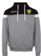
Sweat Accio Junior 35€/Adulte : 40€