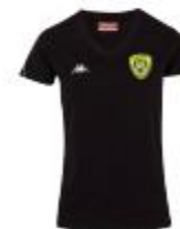
T-shirt Meleti 18€